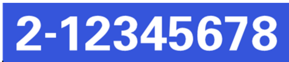
图 2 环保标牌