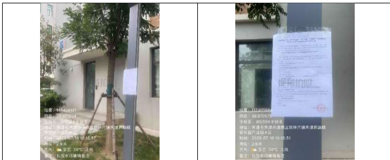
(7) 江恒产业园 11 号