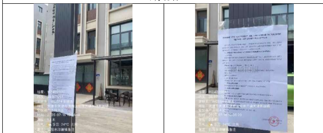
(5) 江恒产业园 6 号楼