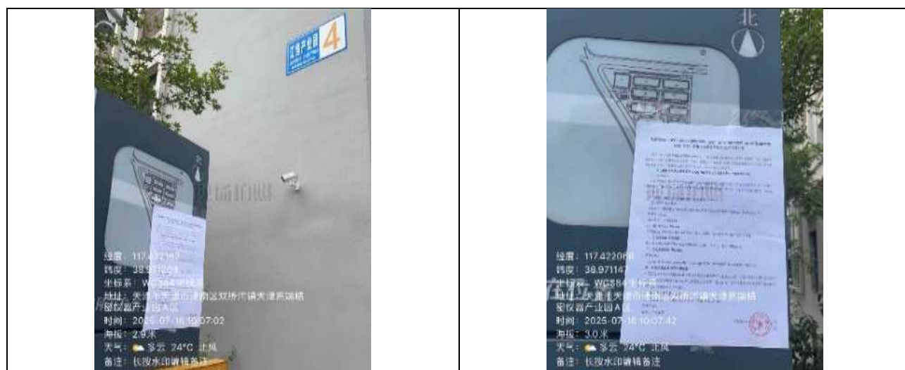
(4) 江恒产业园 5 号楼 1 单元