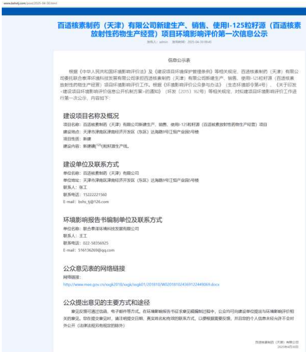
图1 环境影响评价第一次信息公示截图（网络）